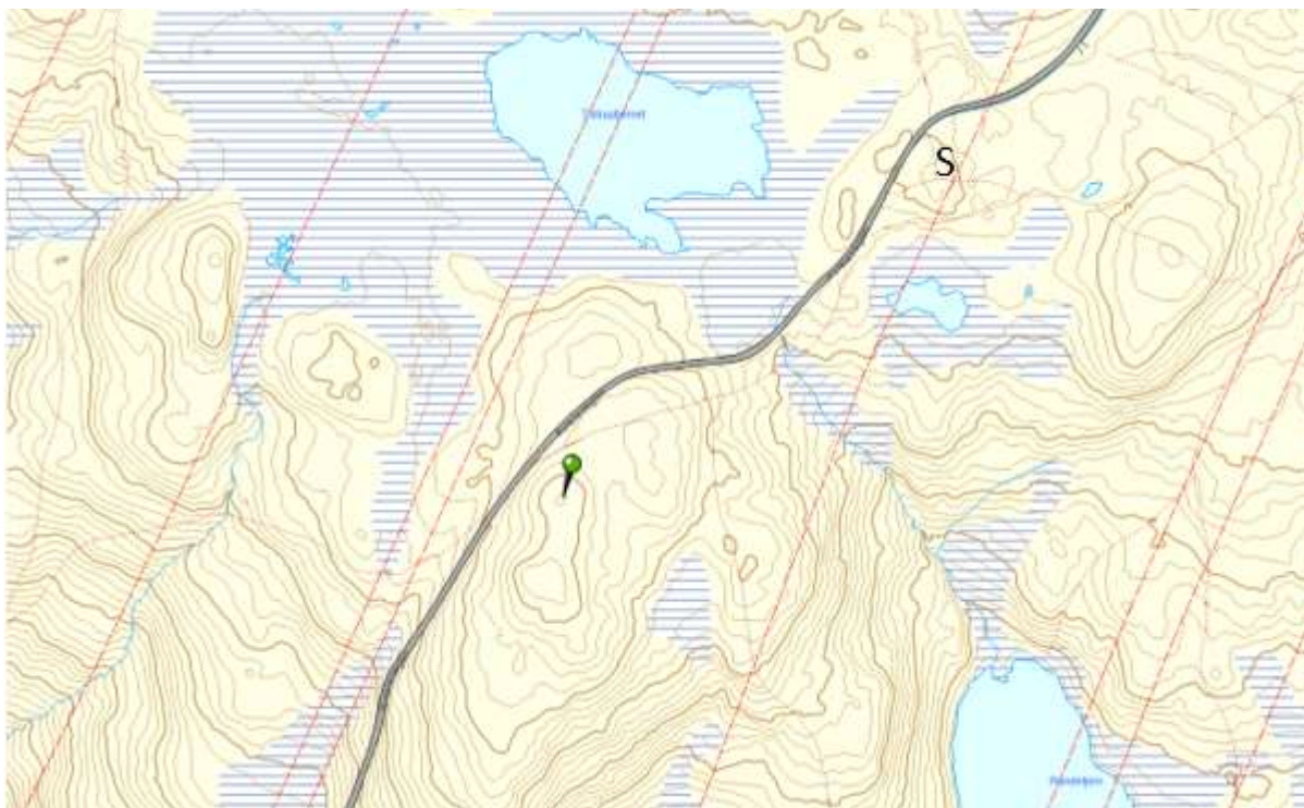
Fig. 2: Kart over Gamle Vardehøgde. Omsøkt plassering av tiltaket er markert. Sonjavarden er markert med «S».